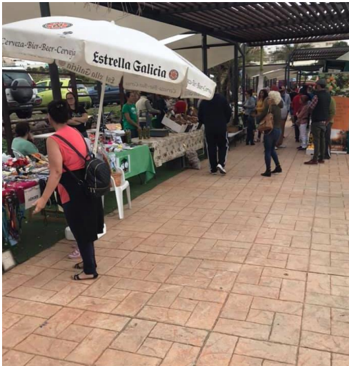
MECARDILLO –AROMEROS- CERRADO