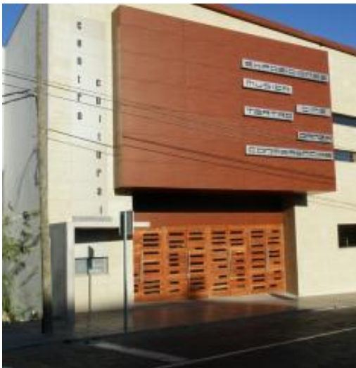
TEATRO DE INGENIO CERRADO.