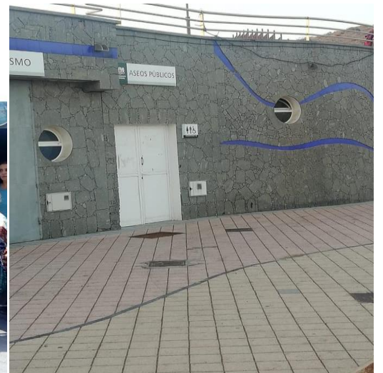
BAÑOS PLAYA DEL BURRERO CERRADOS.