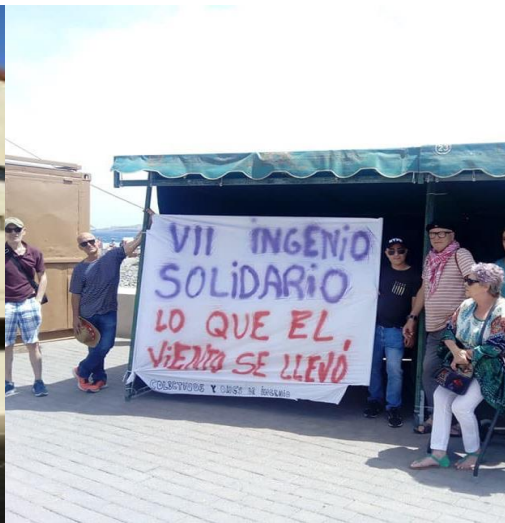
DÍA DE LA SOLIDARIDAD CANCELADO.