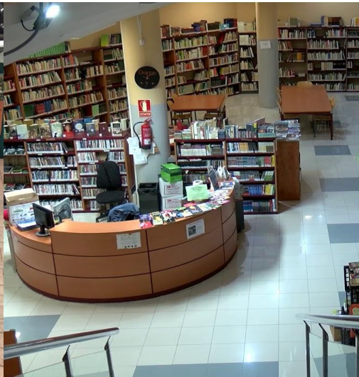
BIBLIOTECA DE CARRIZAL CERRADA.