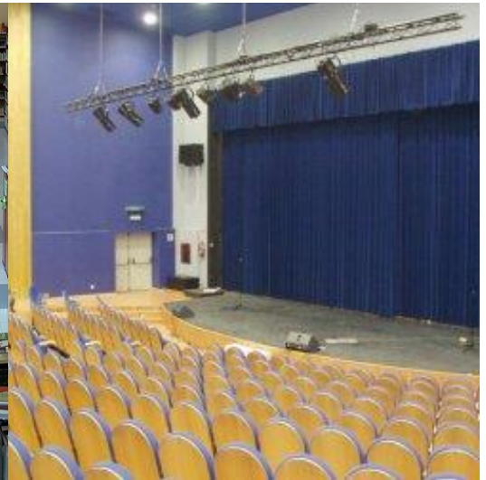
CENTRO CÍVICO DE CARRIZAL CERRADO.